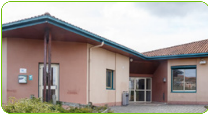
Avant la rénovation