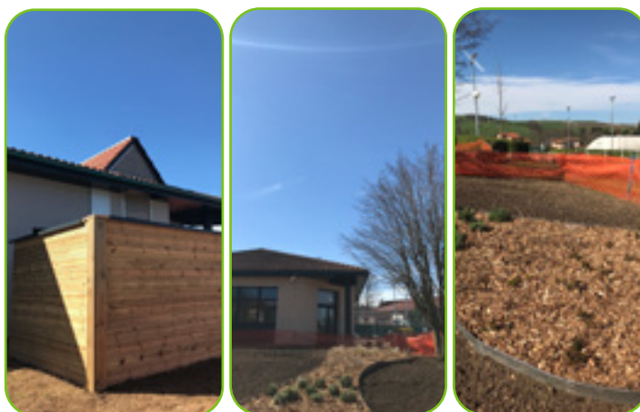
Après la rénovation

Le projet de rénovation énergétique du centre d'animation (CA) a été initié en 2021 suite à des études énergétiques réalisées sur les principaux bâtiments de la commune.