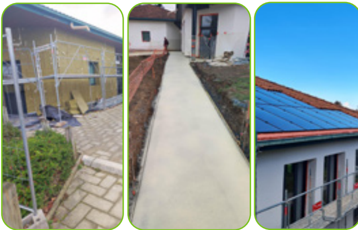
Pendant la rénovation