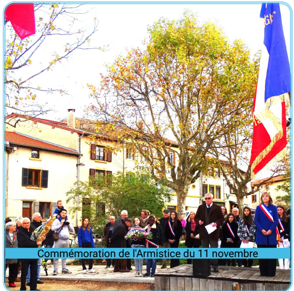
Commémoration de l'Armistice du 11 novembre