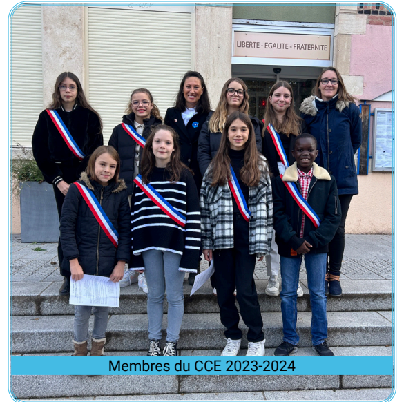
Membres du CCE 2023-2024