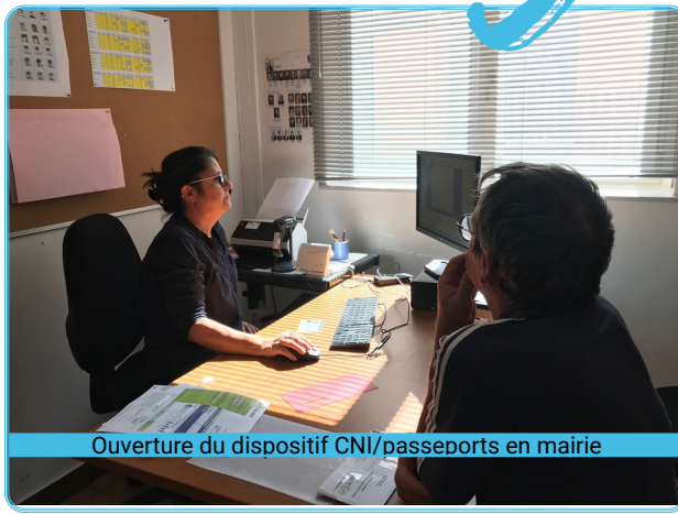
Ouverture du dispositif CNI/passeports en mairie