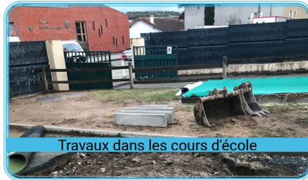
Travaux dans les cours d'école