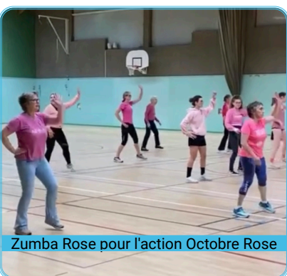
Zumba Rose pour l'action Octobre Rose