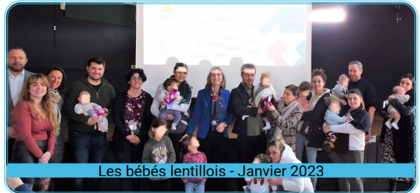
Les bébés lentillois - Janvier 2023