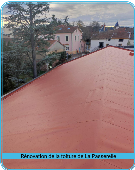
Rénovation de la toiture de La Passerelle