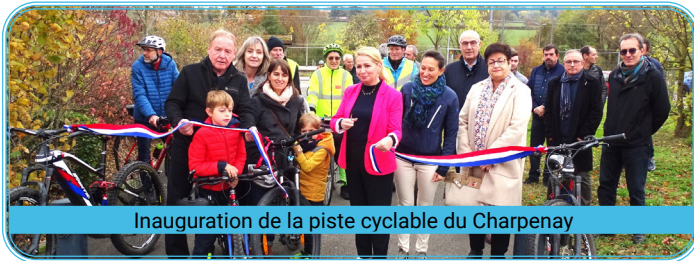
Inauguration de la piste cyclable du Charpenay