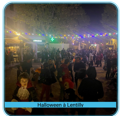
Halloween à Lentilly