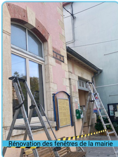
Rénovation des fenêtres de la mairie