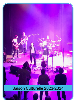
Saison Culturelle 2023-2024