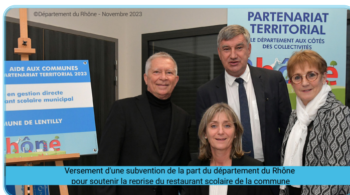
Versement d'une subvention de la part du département du Rhône pour soutenir la reprise du restaurant scolaire de la commune