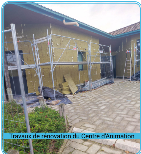
Travaux de rénovation du Centre d'Animation