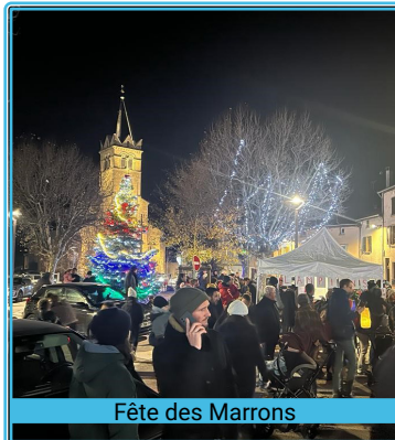
Fête des Marrons