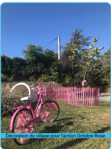
Décoration du village pour l'action Octobre Rose