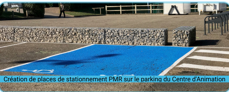
Création de places de stationnement PMR sur le parking du Centre d'Animation