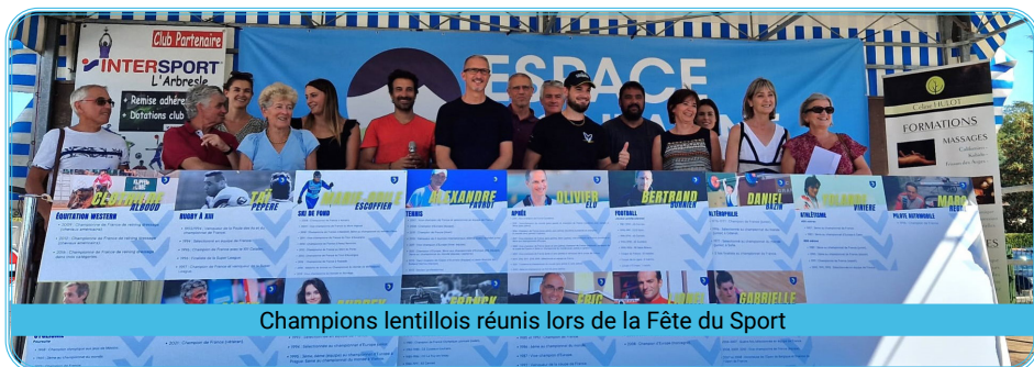
Champions lentillois réunis lors de la Fête du Sport