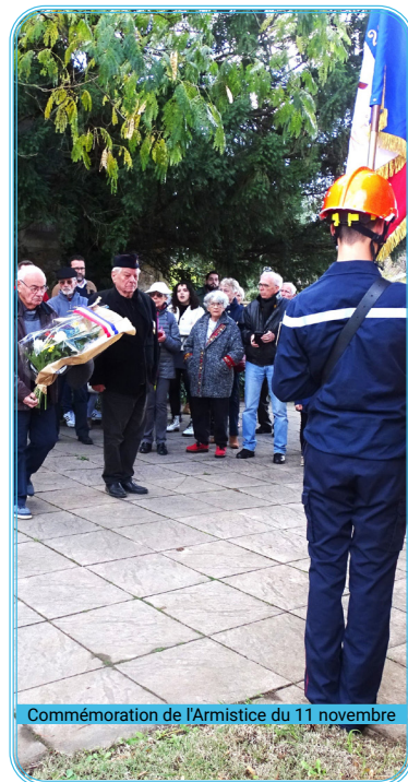
Commémoration de l'Armistice du 11 novembre