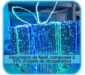
Décoration de Noël, composée à 95% d'objets de récupération