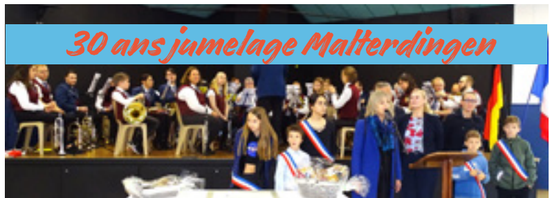
30 ans jumelage Malterdingen