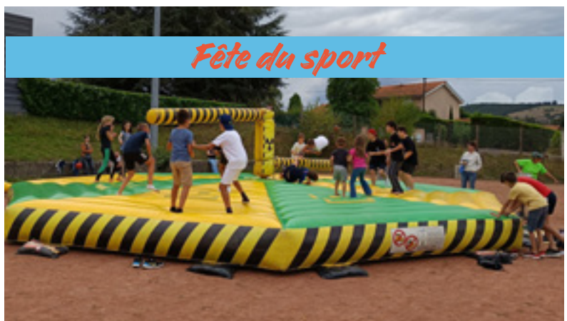
Fête du sport