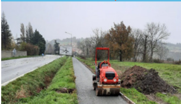
Travaux chemin piéton