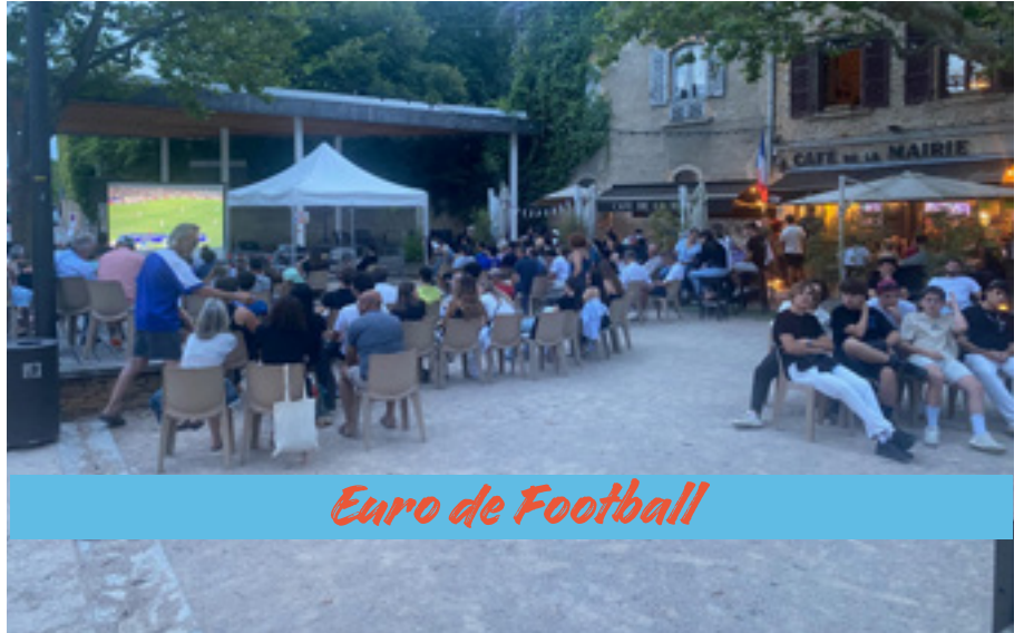
Euro de Football