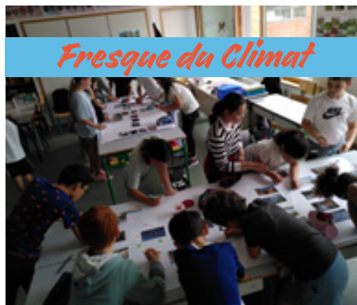
Fresque du Climat