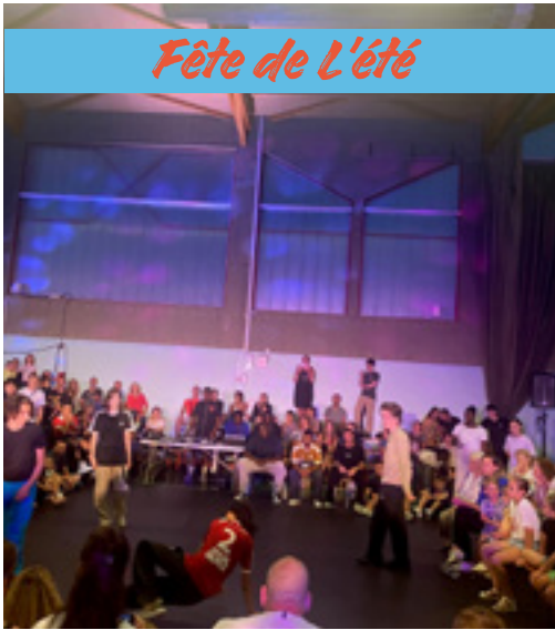
Fête de L'été