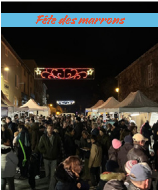
Fête des marrons