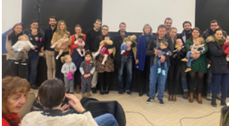
Voeux du Maire 2024