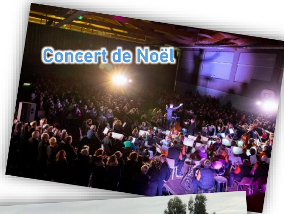
Concert de Noël