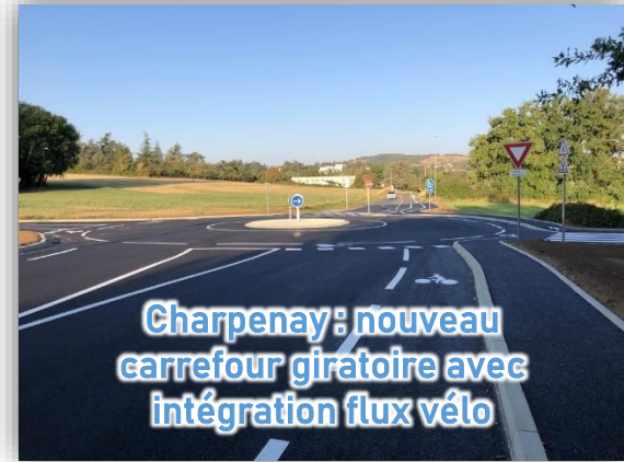
Charpenay: nouveau carrefour giratoire avec intégration flux vélo