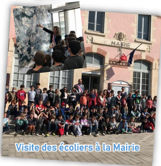
Visite des écoliers à la Mairie