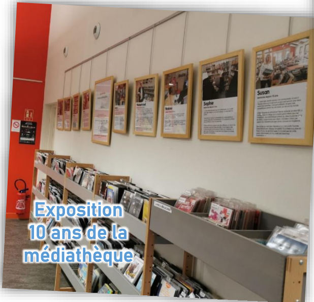
Exposition 10 ans de la médiathèque