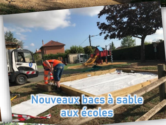
Nouveaux bacs à sable aux écoles