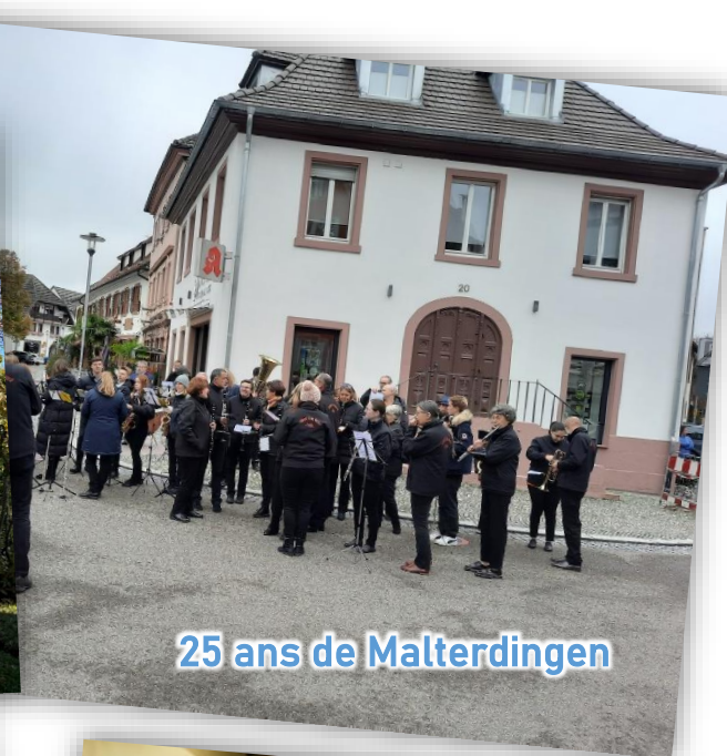
25 ans de Malterdingen