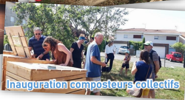
Inauguration composteurs collectifs