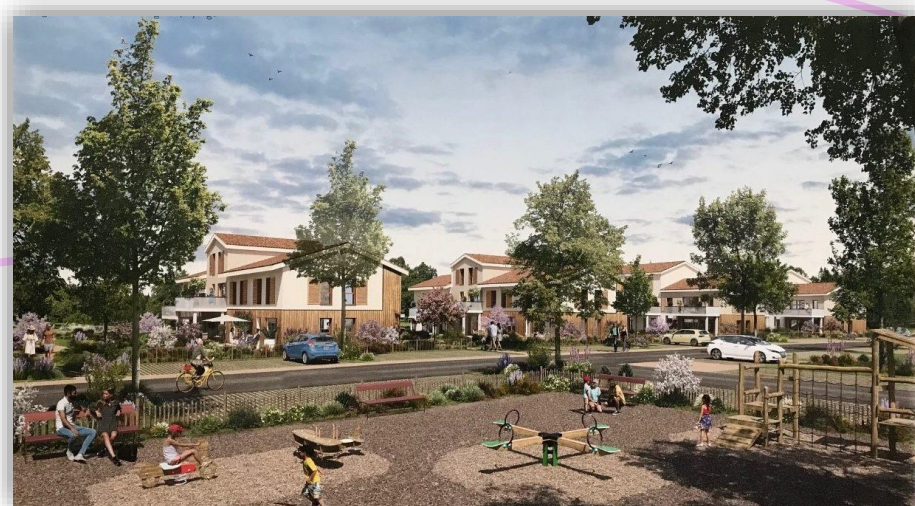
Projet Laval – Perspective depuis le cœur du projet et le futur parc public