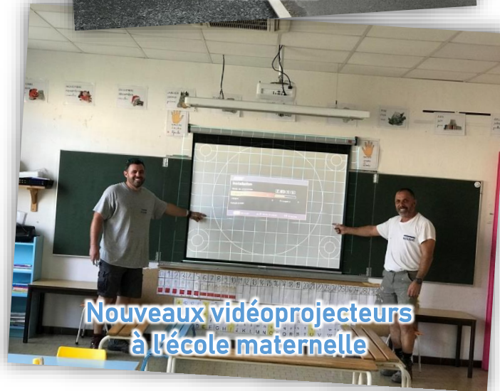
Nouveaux vidéoprojecteurs à l'école maternelle