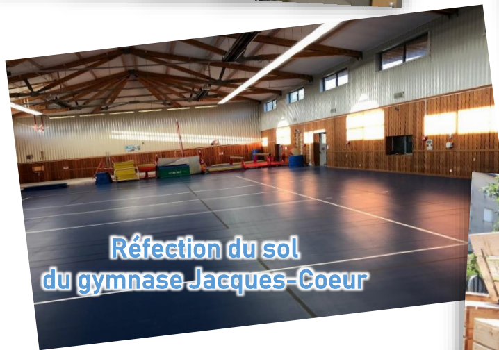
Réfection du sol du gymnase Jacques-Coeur