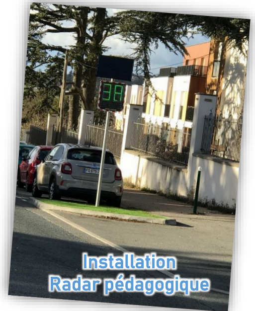
Installation Radar pédagogique