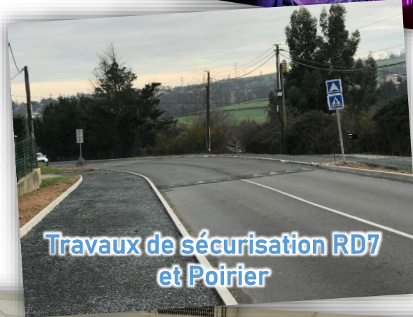
Travaux de sécurisation RD7 et Poirier