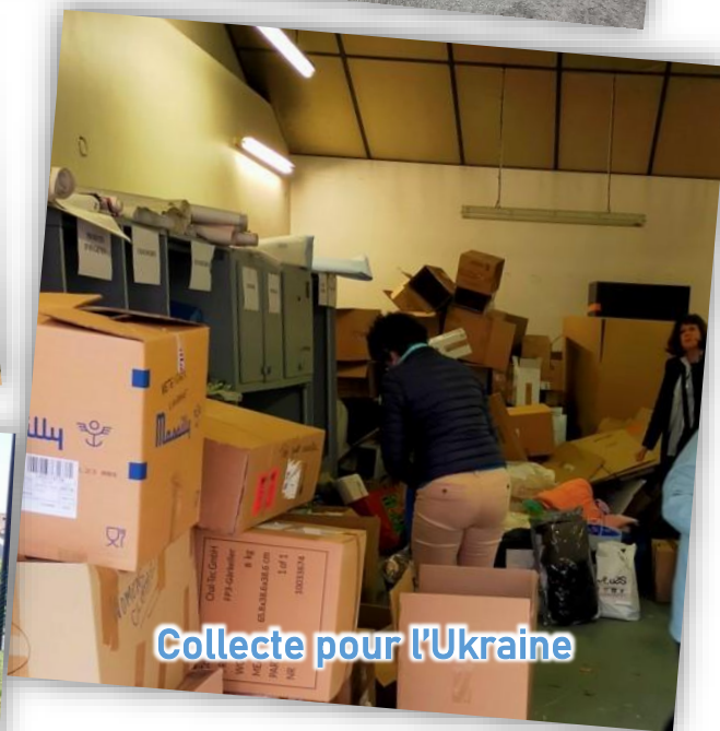
Collecte pour l'Ukraine