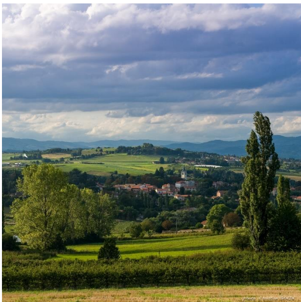
Point de vue sur la silhouette du bourg et son écran verdoyant à préserver